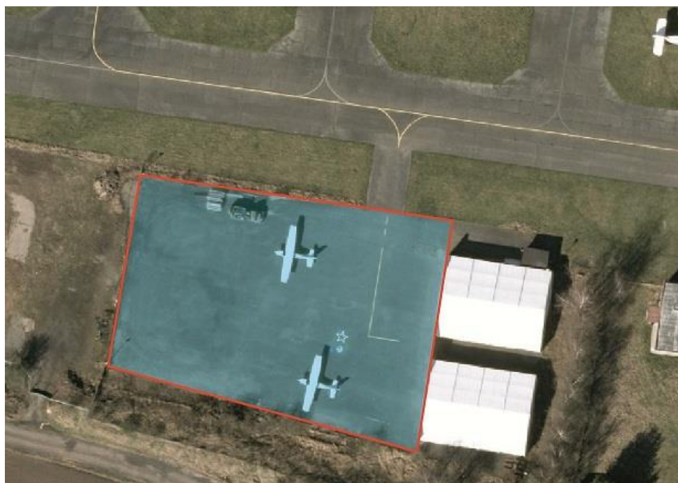
Obrázek 2 Manipulační prostor před hangárem 1.1 b)

Dokument je řízen správcem dokumentace LPL. Po vtištění nebo vytvoření elektronické kopie se dokument stává neřízenou kopií a bude označen na titulní straně jako „KOPIE“.