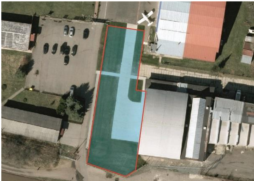
Obrázek 1 Manipulační prostor před hangárem 1.1 a)